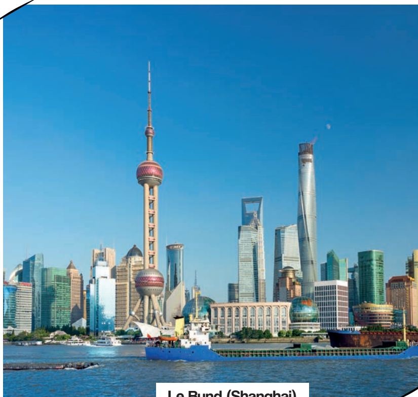
Le Bund (Shanghai)

Toutefois, plusieurs indicateurs invitent à relativiser la gravité de la situation et les fondamentaux économiques demeurent solides : concernant la consommation intérieure, si la demande commence à être saturée dans les grandes villes telles que Pékin ou Shanghai, elle reste encore forte dans les villes de deuxième ou troisième rang où toute une partie de la population doit encore accéder au statut de classe moyenne.