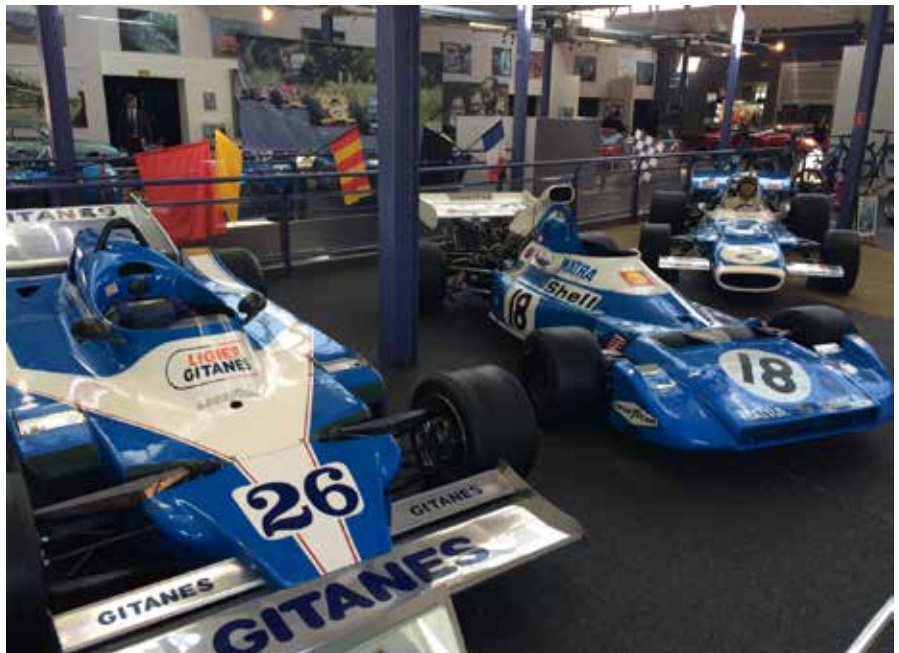
« Dernier constructeur automobile présent en région Centre-Val de Loire, Matra Automobile a fermé ses portes en 2003. Un musée, à Romorantin, retrace son époque automobile »

ment impliquées dans la R&D automobile. La région Centre-Val de Loire compte notamment parmi ses pépites le caoutchoutier Hutchinson, premier employeur privé régional, dont le centre de recherche implanté à Chalette-sur-Loing (45) emploie plus de 200 personnes, auquel s'ajoute une division dédiée aux matériaux composites. Hutchinson a notamment travaillé à réduire le poids des essieux de la Peugeot 208 Hybrid FE. Cette démarche s'inscrit dans la stratégie d'allègement initiée par les constructeurs pour répondre au durcissement de la réglementation européenne sur les rejets de CO 2 . De taille plus modeste, le spécialiste du thermoformage plastique Eurostyle Systems possède à Châteauroux (36) un centre technique d'une centaine de personnes, accolé à son usine de production. Des entreprises régionales soutenues dans leurs projets par le pôle de compétitivité Elastopôle et par les centres de ressources publics tels que le CETIM-CERTEC ou le CERMEL.