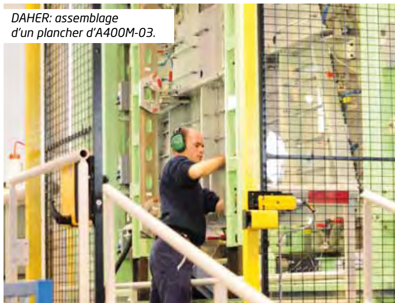
DAHER: assemblage d'un plancher d'A400M-03.

aéronautiques actuels et futurs, dont l'Airbus A350 XWB ou encore le Dassault Falcon 5X. Le site de St-Julien-de-Chédon participe ainsi aux grands projets de Recherche & Technologie menés par le groupe tels qu'EcowingBox pour la conception et la fabrication d'une voilure d'avion d'affaires en composite, ou Advitac, un cône arrière d'avion d'affaires qui fut présenté lors du JEC Composites Paris 2014. Parce que le secteur aéronautique est en croissance et que les matériaux composites représentent un matériau d'avenir, DAHER parie sur une croissance soutenue de son activité composite... en région Centre.